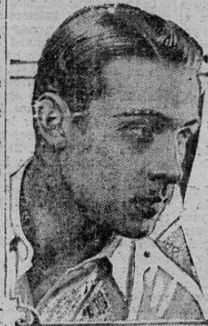
Rodolph Valentino from the Paramount Picture

NOCHE DE MODA EN EL MODERNO. OBSEQUIO DE TARJETAS A LAS DAMAS. ESTA NOCHE "EL HIJO DEL SHEIK" POR EL LLORADO IDOLO RODOLFO VALENTINO